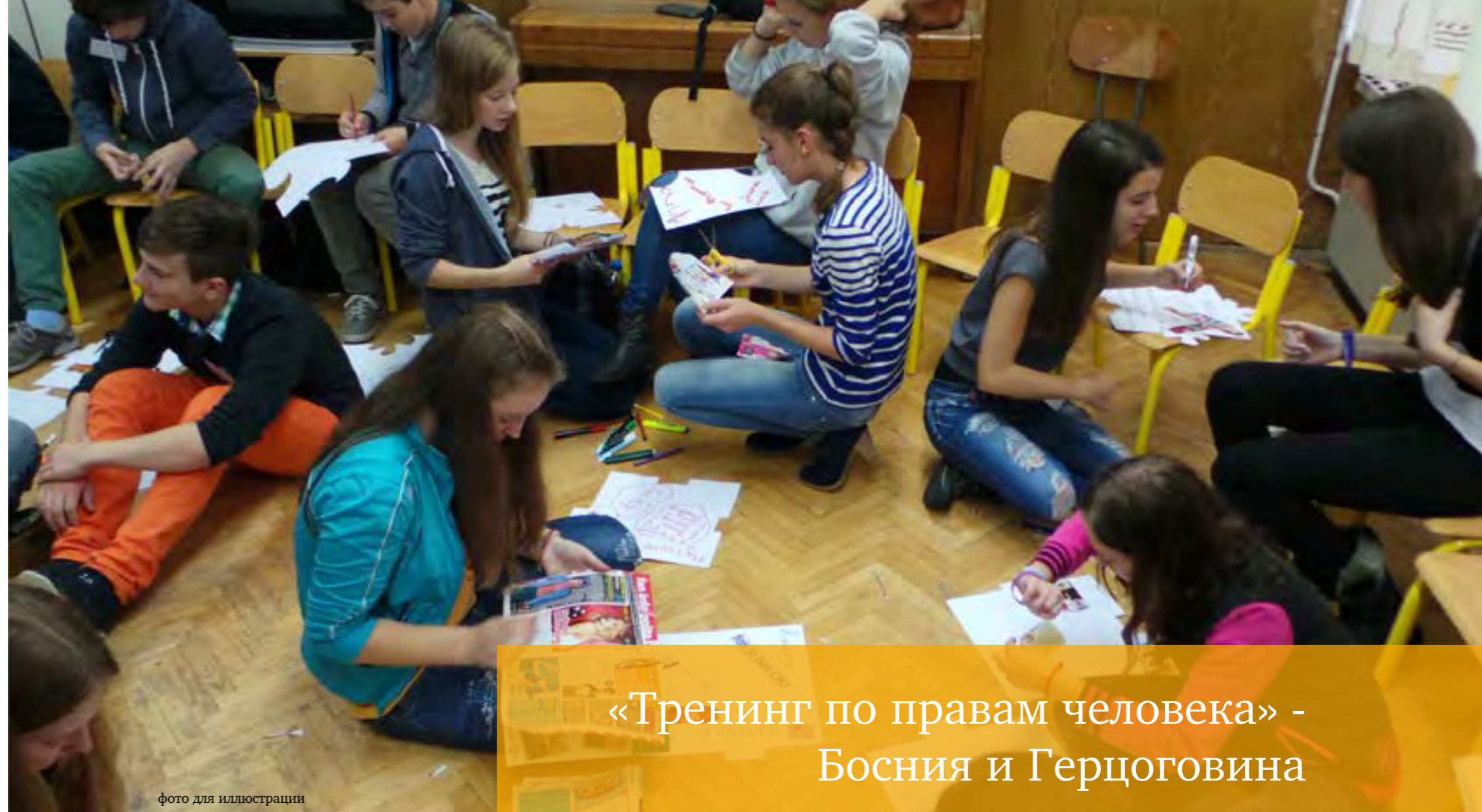
фото для иллюстрации

«Работа с новыми техниками и методами дает чувство свежести, учащиеся становятся более коммуникативными, и атмосфера в классе совершенно другая», - утверждает Адиса, учительница математики 8-го класса, Сараево.