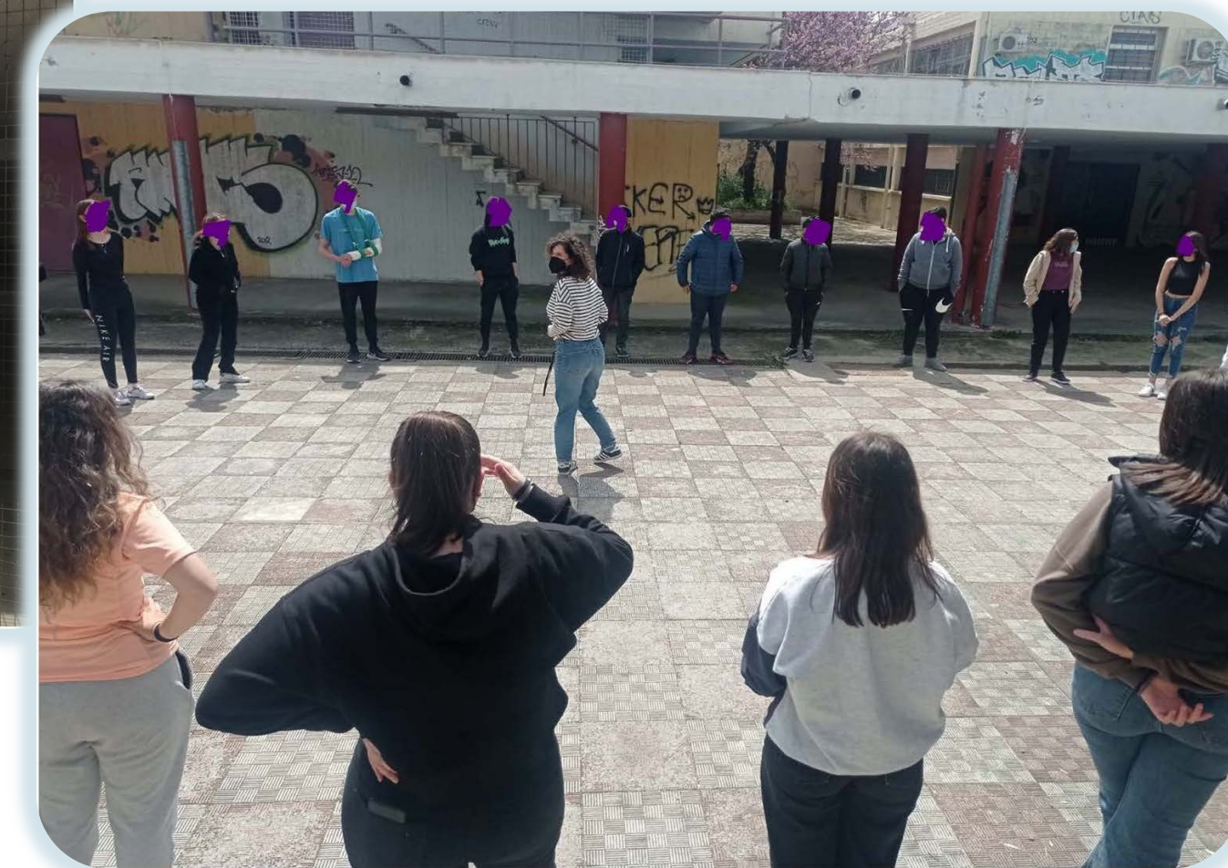
Τοποθέτηση φιλολόγου για Τμήμα Υποδοχής (03/05/2022)

Επιμόρφωση εκπαιδευτικών 6 ου ΓΕΛ Αιγάλεω (29-30/11/2021)