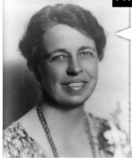
Άννα Έλινορ Ρούζβελτ

“ Κανείς δεν μπορεί να σε κάνει να νοιώσεις κατώτερος χωρίς τη συγκατάθεσή σου.