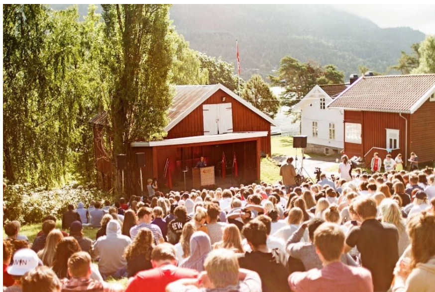
Slik ser det ut på sommerleir.

AUF er ungdomspartiet til Arbeiderpartiet, som er det største politiske partiet i Norge. Ungdommene som er med i et ungdomsparti er opptatte av å jobbe for å gjøre Norge til et enda bedre land å bo i. AUF har hatt sommerleir på Utøya i veldig mange år. Da møtes ungdom fra hele Norge for å treffe andre ungdommer, diskutere politikk og ha det hyggelig sammen. Da bomben eksploderte i Oslo, ble alle ungdommene samlet til et møte. Mange var redde for familie og venner som var i Oslo, og mange ringte hjem til familiene sine.