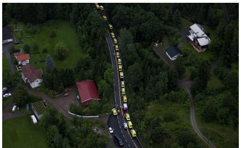
Ambulanser som henter skadete på Utøya.

Rundt omkring i hele Norge gikk det opp for folk at det ikke bare var eksplodert en bombe i Oslo, men også at det skjedde grusomme ting på Utøya. Spesielt de som hadde barn, venner og familie som var på Utøya var redde.