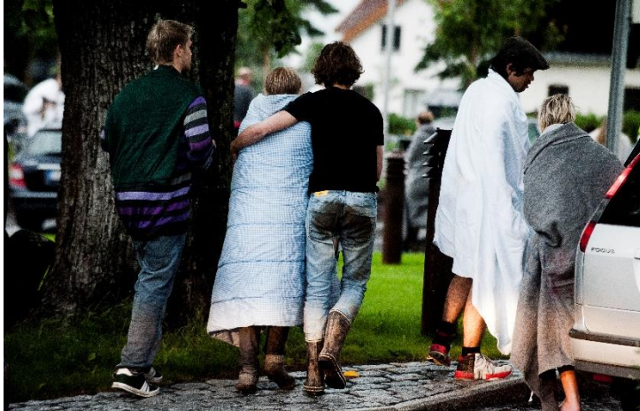
Ungdommer som kommer til Sundvollen hotell i nærheten av Utøya.

Det var gått mer enn en time fra terroristen begynte å skyte, til politiet klarte å stoppe han. Men da var 69 mennesker døde og nesten like mange skadet.