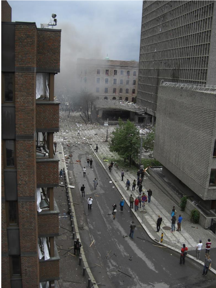
Slik så det ut i regjeringskvartalet 13 minutter etter bomben.

Terroristen hadde planlagt terrorangrepet veldig lenge. Bomben var gjemt i en bil som han parkerte rett utenfor Høyblokka. Da bomben eksploderte, hadde han allerede hentet en annen bil, og var på vei ut av byen.